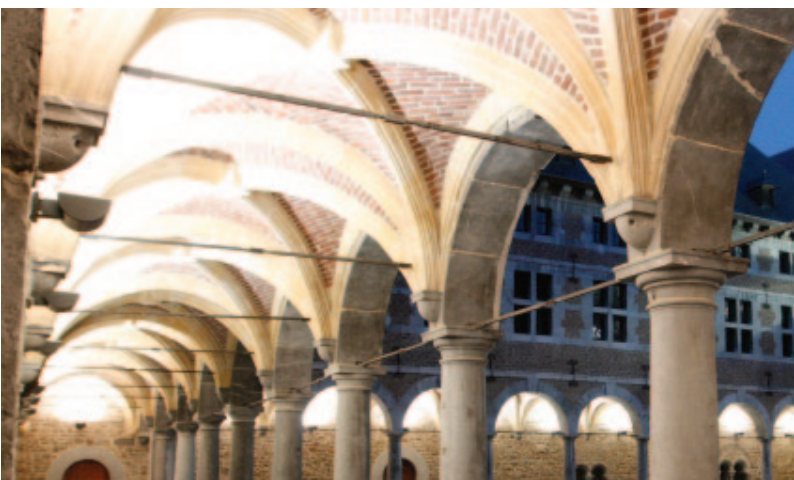
Le Musée de la Vie Wallonne à Liège ( 1000 m 2 )