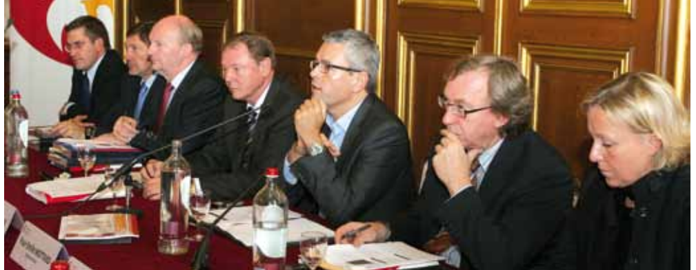
L'ensemble du Collège a présenté à la presse le budget 2011, c'est-à-dire les prévisions des recettes et des dépenses pour l'année à venir.

Tels sont les 4 grands principes de ces prévisions pour les 12 mois à venir. Le budget extraordinaire permettra la construction de la phase 2 de la Maison de la formation basée à Seraing mais aussi la création de