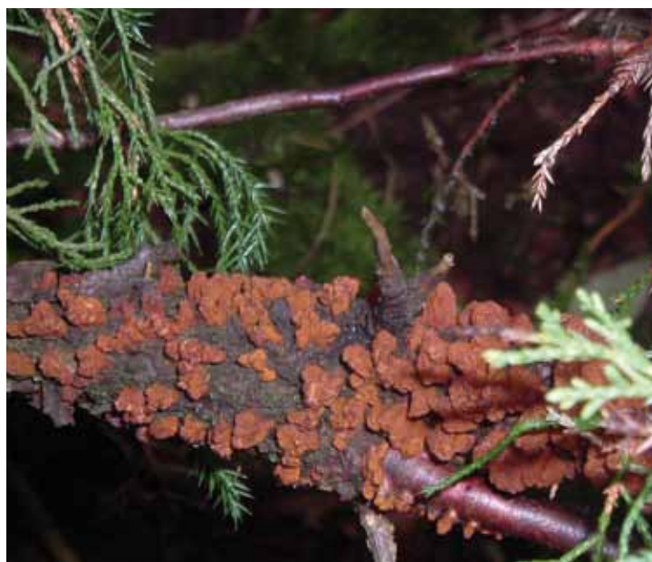
Les signes de l'infection sont réellement visibles, n'hésitez pas à sonner l'alarme.

Infos : Michaël Dossin ASBL PROFRUIT 04/345.90.01