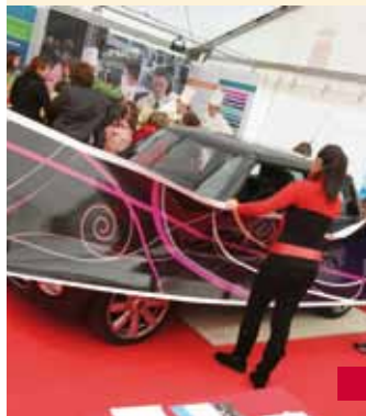
Découvrez notre Province lors de son village. Etapes à Ans (28 et 29/01), Huy (25 et 26/02), Verviers (25 et 26/03).

■ Jusqu'au 7/01 : exposition des calendriers 2011 de « La nouvelle poupée d'encre », à la Bibliothèque des Chiroux (rue des Croisiers, 15). Infos : 04/232 86 46 ■ 4, 5, 6/02 : 3 e Salon du Volontariat à l'Abbaye Saint-Laurent (Rue Saint-Laurent, 79). ■ 13/01 à 20h15 au Palais des Congrès : « Après la crise » par Alain Touraine. Infos : Office du Tourisme : 04/221 92 21 ■ 17/02 à 20h15 au Palais des Congrès : « Crise du multiculturalisme et montée des intégrismes » par Caroline Fourest. Infos : Office du Tourisme : 04/221 92 21 ■ 17/03 à 20h15 au Palais des Congrès : « Est-il encore possible d'être adolescent aujourd'hui ? » par Marcel Rufo, pédopsychiatre. Infos : Office du Tourisme : 04/221 92 21 ■ 12, 26/01 - 9, 23/02 - 9, 23/03 : Présence du Bibliobus à différents endroits de la commune. Infos : 04/237 95 05 MUSÉE DE LA VIE WALLONNE Infos : 04/237 90 50 ■ Jusqu'au 31/12 : 16 e Salon wallon des métiers d'arts à l'espace Saint-Antoine. ■ Jusqu'au 31/03 : Exposition « Vie de Grenier ».