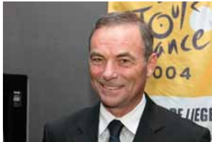
Miguel Indurain, Eddy Merckx, Bernard Hinault : 3 légendes à Liège pour la présentation du Grand Départ.