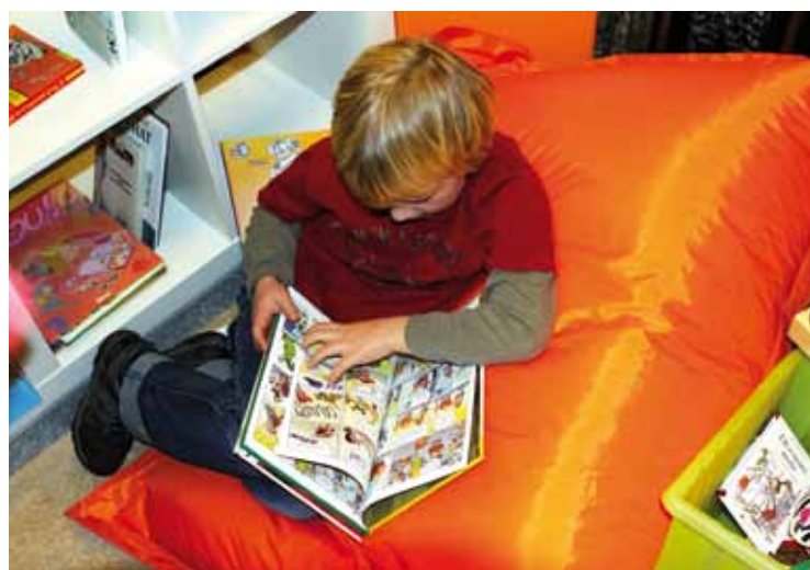
Espace d'accueil et de consultation, openado est un lieu de rencontre entre enfants, adolescents, parents et professionnels. Les pièces ont été aménagées par un architecte d'intérieur afin de favoriser l'échange et la discussion en toute confidentialité. Ordinateurs et livres sont à la disposition des jeunes qui voudraient venir décompresser dans cet espace.