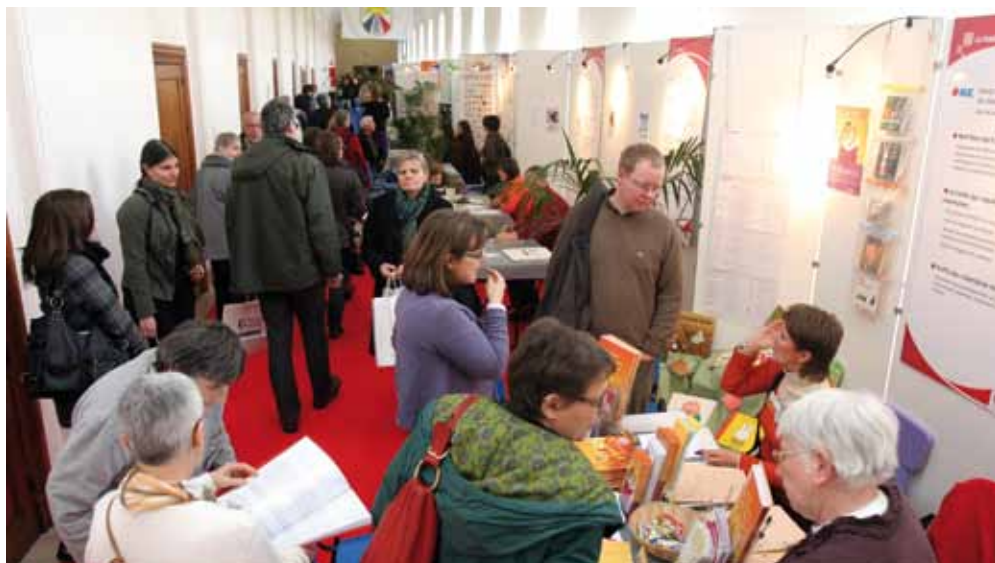
Vous étiez plus de 6.400 à arpenter les allées du Salon du Volontariat l'an dernier.

Pour offrir une représentation très large du volontariat social, le salon rassemblera plus de 100 associations, regroupées en sept thèmes : jeunesse, aide sociale en général, famille, personne handicapée, personne âgée, santé et coopération