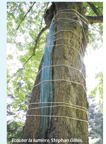
Ecouter la lumière, Stéphan Gilles.