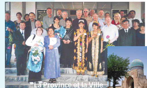
La Province et la Ville de Liège en Ouzbékistan

D'autre part, un nouveau concours Francofolies-Thermes de Spa est également proposé dans nos pages, ainsi qu'un concours pour 100 x 1 entrée aux Prés de Tilff , un concours Festival Vacances Théâtre de Stavelot et enfin, un chèque-cadeau de 110 € en collaboration avec la FTPL pour vos futures sorties familiales. pages 6 et 7