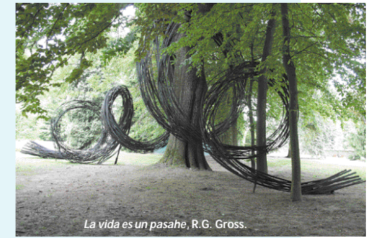
La vida es un pasaje, R.G. Gross.

Le prix d'entrée au Domaine de Jehay : 2,50 € pour le parc et les jardins 5,00 € pour le château.