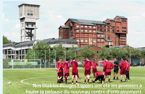
Nos Diables Rouges Espoirs ont été les premiers à fouler la pelouse du nouveau centre d'entraînement.

Géré par l'asbl CREF et le Service des Sports de la Province, le site propose deux magnifiques terrains éclairés, l'un synthétique l'autre master-grass (semi-synthétique) ; une infrastructure