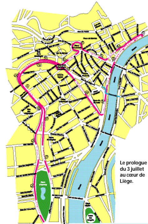
Le prologue du 3 juillet au cœur de Liège.

Infos/tarifs : adultes 10 € - enfants 8 € (gratuit pour les moins de 3 ans, les plus de 60 ans et les handicapés). Ouvert tous les jours de 10 à 22h. Tél. : 04/ 360 04 04.