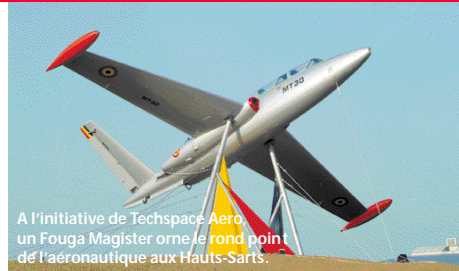
A l'initiative de Techspace Aero, un Fouga Magister orne le rond point de l'aéronautique aux Hauts-Sarts.

Pour ses 25 ans, Techspace Aero, filiale de la société française SNECMA, a décidé de faire restaurer le Fouga Magister installé jusqu'à présent à l'entrée de l'usine et propriété du Musée Royal de l'Armée de l'Air. C'est le Centre de compétence du matériel roulant et de l'Armement, l'ancien Arsenal, installé non loin à Rocourt qui a procédé à la rénovation de l'avion lui redonnant son éclat d'antan.