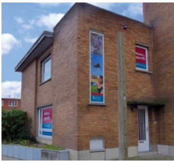
Maison des sportifs (...) pg 5