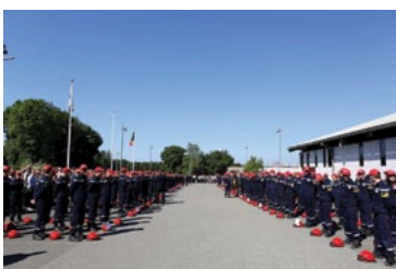
Venez découvrir les jeunes Cadets de l'Ecole du Feu. (...) pg 11