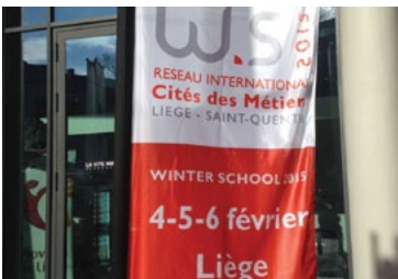
Winter school pg 6