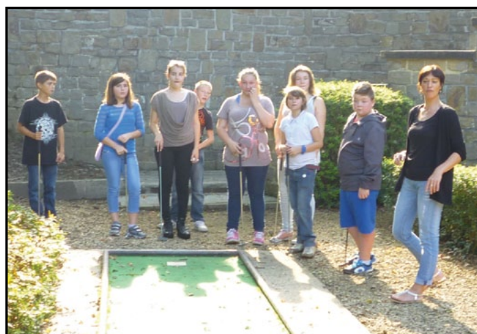
Les élèves de 1 er année de l'IPES ont participé à une journée de sports-découverte, à Wégimont

La rentrée à l'IPES, c'était aussi l'accueil des parents et des élèves de 1 er année dans sa belle salle de spectacle avant la visite de l'école et le partage d'un croissant au restaurant scolaire. Et puis, pendant que les professeurs accueillaient leurs nouvelles « ouailles », les explications de la direction sur le fonctionnement du 1 er degré aux parents. Echanges fructueux et confiance réciproque sont à compter aux bénéfices de la journée.