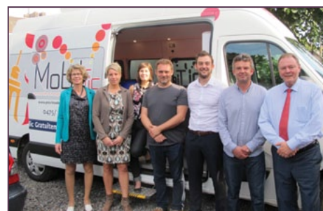
MobiTIC, structure mobile d'initiation des seniors à l'utilisation d'Internet et des Technologies de l'Information et de la Communication.. p.10