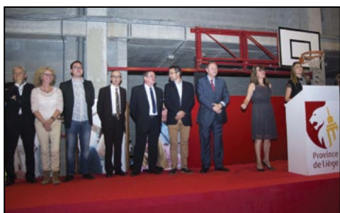
L'Athénée Guy Lang. p.5