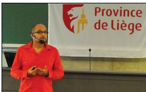
Rentrée académique. p.6