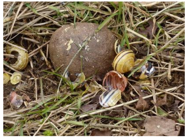
Pierre utilisée comme enclume

Les escargots de couleur foncée se réchauffent plus vite sous l'action du soleil que ceux qui présentent une coquille claire.